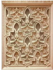
Рис.1 Приклад застосування

традиційним народним мистецтвом, можуть відігравати вагому роль у розробці інтер'єрів, які репрезентуватимуть українську культуру.