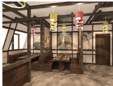
Рис 3. Дизайн ресторану в японському стилі («Rokkasen Otakibashiidori», Токіо, Японія)