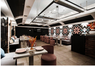
Рис 1. Дизайн ресторану в українському скандинавському стилі («Prynada Ukrainian Cafe», Київ, Гельсінкі, Україна) Фінляндія)

сучасних потреб сприяє їх популяризації та створенню нових дизайнерських рішень, що робить кожен заклад неповторним. Сучасні технології дають змогу органічно поєднувати традиційні мотиви з функціональністю, зберігаючи при цьому естетичну виразність інтер'єру. Використання локальних матеріалів і ремісничих технік не лише надає простору автентичності, а й підтримує розвиток місцевих традицій, роблячи дизайн більш глибоким і змістовним.